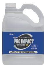
リンレイ NEWプロインパクト中性 4L